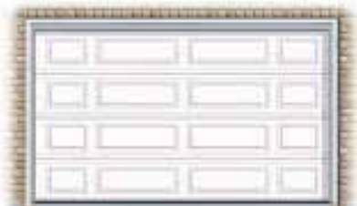
Motifs rectangulaires mixtes (MIX)