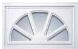
Appliques de plastique