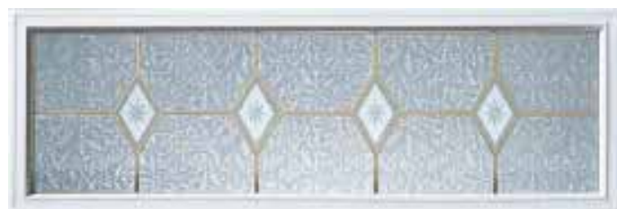
Caprice 40 x 13 po

Coupe-froid de cadrage avec cache-vis extérieur et coupe-bise à double contact. Améliorent considérablement l'étanchéité de la porte.