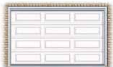
Motifs rectangulaires allongés (XL)