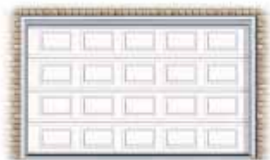
Motifs rectangulaires classiques (CC)